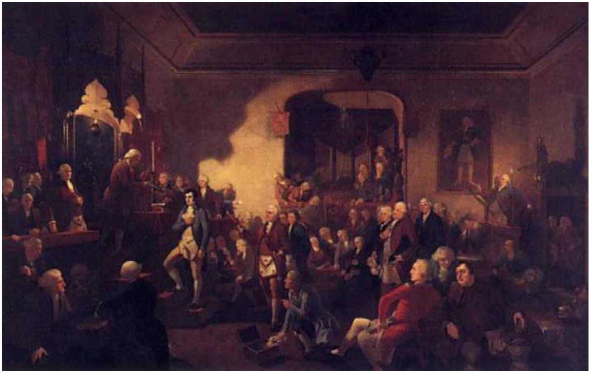
Instalación del Hermano Robert Burns como poeta laureado en la logia Canongate de Kilwning el 1 de marzo de 1787 (Óleo de Steward Watson conservado en la Gran Logia de Escocia)