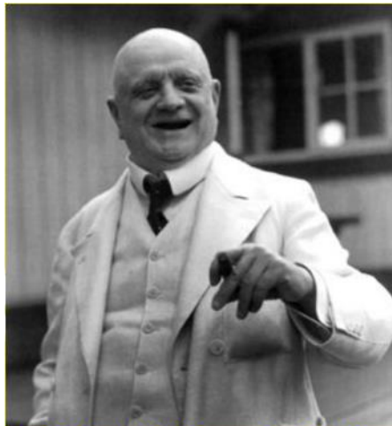
Jan Sibelius (1865-1957) compositor finlandés que fue iniciado en agosto de 1922 y exaltado a la maestría en la Logia Suomi n° 1 de Helsinki

Jan Sibelius fue un compositor finlandés de música sinfónica. Nació el 8 de diciembre de 1865 en Hämeenlinna (Gran Ducado de Finlandia) y falleció el 20 de septiembre de 1957 en Järvenpää (Finlandia).