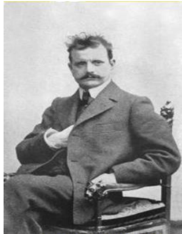
Jan Sibelius (1865-1957)