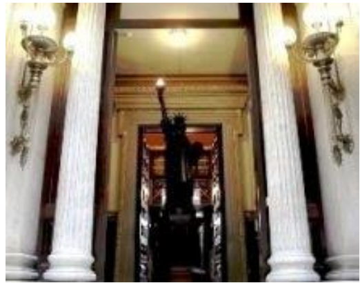
Biblioteca Pública Arús (Barcelona)

Rossend Arús, culto, demócrata, liberal les había encargado crear una biblioteca para el pueblo de Barcelona. Bonaventura Bassegoda, arquitecto, y Pere Bassegoda, contratista, se encargaron de las obras de remodelaje; Josep Lluís Pellicer cuidó de la decoración; Manuel Fuxá, de las obras escultóricas, etc. Una entrada independiente, amplia, suntuosa, con una escalinata de mármol de tres tramos, de siete, diez y diez escalones, iluminada por cuatro enormes candelabros de bronce y cristal tallado, le aseguró el acceso directo desde la calle. El zócalo es de mármoles de colores. Remata la escalera un peristilo de gusto clásico, con cuatro columnas jónicas a cada lado más las dos que flanquean la puerta de entrada, a cuyos pies mármoles de colores dibujan la palabra Salve dirigida a quien quiera que llegue. También una réplica de dos metros aproximadamente, de la estatua de “la Libertad iluminando al mundo” del masón Bartholdi,