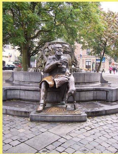
Estatua sedente de Buls y su perro erigida en 1999 en la plaza Agoraplein cerca de la Grand Place de Bruselas