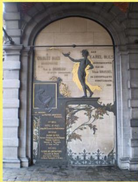
Monumento diseñado por Victor Horta y ejecutado en 1899 por Victor Rousseau en honor a Buls, en la Grand-Place de Bruselas