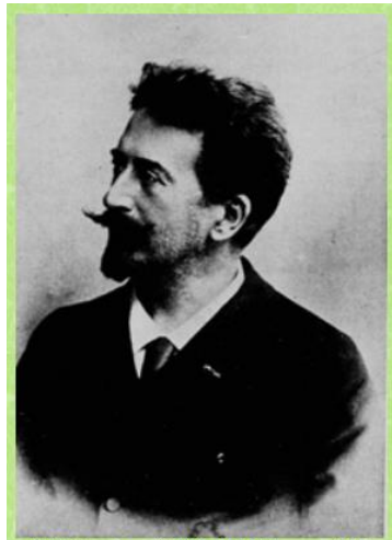
Félicien Rops (1833-1898) fue recibido masón el 1 de julio de 1861 en la logia "La Bonne Amitié" de Namur del Gran Oriente de Bélgica

Inconformista, iconoclasta, dandy crapuloso y esteta, el pintor y grabador Félicien Rops es, sin duda, una de las personalidades más interesantes de la Bélgica decimonónica. Ilustrador de renombre y genial aguafuertista, sus creaciones—delirio, dolor y desafío entreverados—se encuentran en la cima del cosmopolitismo decadente y el simbolismo internacional.