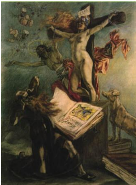
Las tentaciones de San Antonio