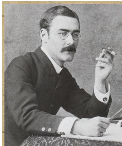
Joseph Rudyard Kipling (1865-1936) fue iniciado en Masonería en la Logia "Esperanza y Perseverancia n° 782 de Lahore (Punjab, India) el 5 de abril de 1886. El 3 de mayo obtuvo el pase al grado de Compañero y el 6 de diciembre fue elevado al de Maestro Masón. Fue fundador de la Logia The Builders of the Silent Cities, que levantó columnas en 1927

Joseph Rudyard Kipling (Bombay, 30 de diciembre de 1865 - Londres, 18 de enero de 1936), fue un escritor de origen británico. Su segundo nombre hace referencia al lago Rudyard, en Staffordshire, Inglaterra, donde sus padres se conocieron. Educado en Londres, se desplazó a Lahore, donde su padre desempeñaba en el cargo de director de la Escuela de Bellas Artes, y durante siete años trabajó como periodista en la India. Luego viajó por Birmania, Japón y los Estados Unidos escribiendo cuentos y baladas que se convertirían en 1890 en un éxito editorial.