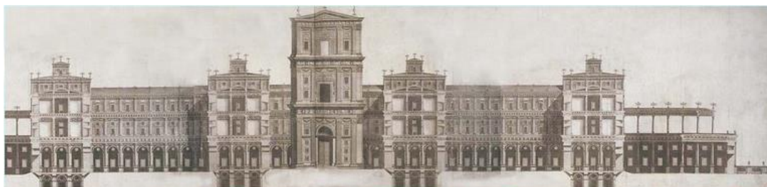
Idealización del Templo de Salomón según el arquitecto jesuita del siglo XVI Juan Bautista Villalpando

En el símbolo masónico, la «Piedra cúbica con punta» es una representación de la Piedra Filosofal (la figura de un hacha de la cúspide representa el jeroglífico del Polo).