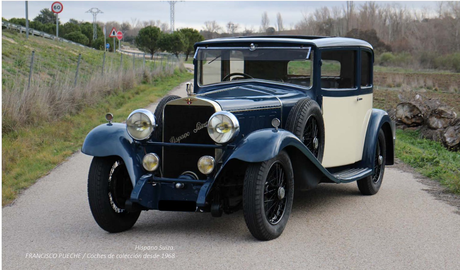
Hispano Suiza.

El que suscribe vio como en una restauración que acometía de un Rolls de los años 30, ese servo de diseño español seguía funcionando.