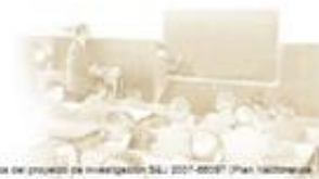
La retrovisión de este sitio de MANES ha sido posible gracias a los recursos científicos de proyecto de Investigación SGI 2007-00097 (Plan Nacional sobre I+D+i, Ministerio de Ciencia e Innovación de España).