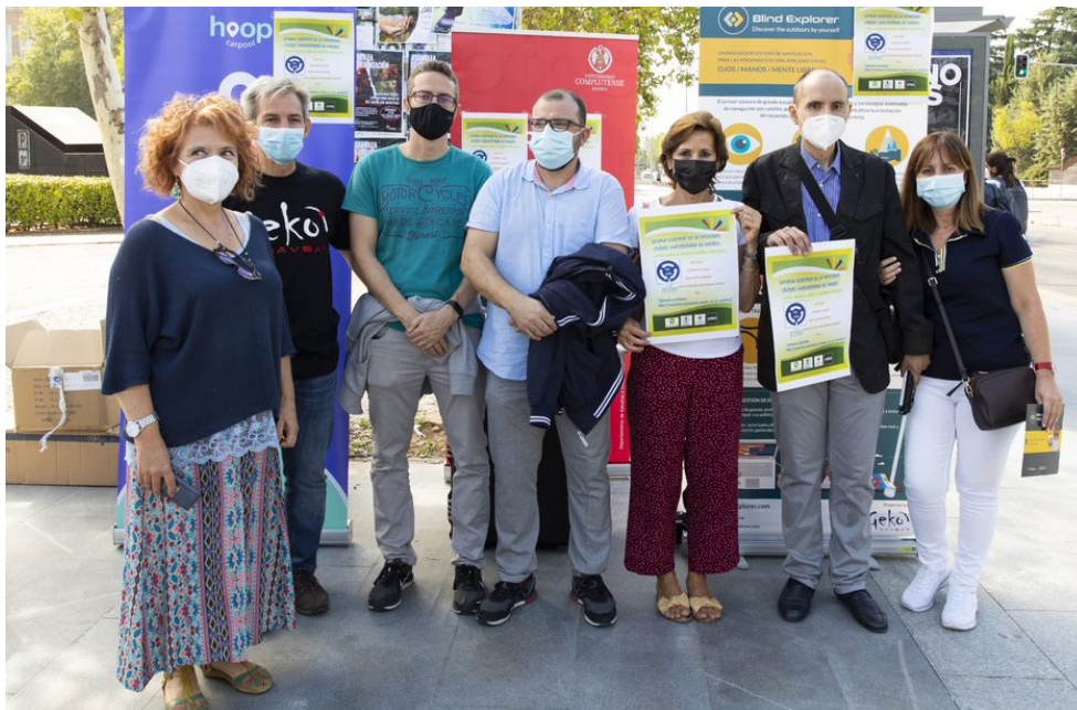
Grupo del Consorcio con el director general de Geko Navsat y representantes de las unidades de atención a la discapacidad de las universidades Complutense de Madrid, Universidad Politécnica de Madrid y UNED).

UNIDIS, Centro de atención a los universitarios con discapacidad de la UNED participó en la presentación de la aplicación de guiado sensorial en la Semana Europea de la Movilidad (Ciudad Universitaria de Madrid, 16 de septiembre de 2021)