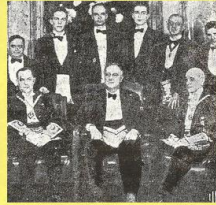
Franklin Delano Roosevelt, presidente de los Estados Unidos (1933-1945) fotografiado en un acto masónico con el alcalde de Nueva York, Fiorello LaGuardia y otros Hermanos