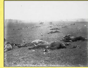
Monumento a la Batalla de Gettysburg que tuvo lugar del 1 al 3 de julio de 1863 situado en el Cementerio Nacional de Gettysburg, Pennsylvania, erigido por la Gran Logia de New York. Aunque fue una victoria para el Ejército federal y un hecho desastroso para la Confederación supuso en todo caso la muerte de miles de personas. El monumento masónico lleva la divisa: "De amigo a amigo una Única hermandad!". El último día de la batalla, Armistead, bajo el mando de George Pickett, gravemente herido "dio una señal masónica" para que alguien escuchara sus últimas voluntades. El capitán de la Unión, Henry H. Bingham, asesor del Mayor General Winfield S. Hancock, vino en su ayuda. La escena representa al General de la Confederación, Lewis A. Armistead confiando sus últimas voluntades al capitán de la Unión, Henry H. Bingham. Armistead, Bingham y Hancock eran masones. Repárese en la posición del caído, rodilla ligeramente levantada, y las manos de ambos, evocando la resurrección del maestro Hiram Abi