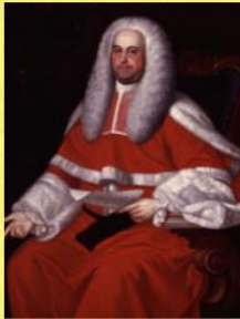
Jonathan Belcher, natural de Boston, iniciado en 1704 en una logia de Londres. Fue gobernador de Massachussets y New Hampshire

El primer masón conocido en la historia de Estados Unidos fue John Skene. Había ingresado en la Logia número 1 de Aberden, Escocia, en 1682. Ese mismo año emigró a Norteamérica, instalándose en Burlington, estado de Nueva Jersey, del que llegaría a ser vicegobernador en 1685 y hasta su muerte en 1690. El primer masón nacido en Estados Unidos fue Jonathan Belcher, natural de Boston, donde viera la luz el 8 de enero de 1681. Durante una estancia en Londres, Belcher se afilió a una logia masónica (1704). Fue gobernador colonial de Massachussets y New Hampshire. Con el paso del tiempo, otros masones debieron emigrar a Norteamérica. Massachussts y Pennsylvania en 1730 disponían de logias masónicas.