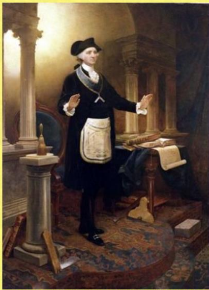
George Washinton, primer Presidente de los EEUU, iniciado en 1753 en la logia Fredericksburg de Virginia

La influencia de la masonería en algunos casos ha sido exagerada. Para muchos historiadores, el papel de la masonería en el Motín del té de Boston no habría sido determinante. Uno de los mayores ideólogos de la revolución, el inglés Thomas Paine, no era masón. Los líderes de la mayoría de las grandes logias en América eran leales al rey. De los siete Grandes Maestres de provincias, cinco apoyaron al rey. Varios masones muy conocidos, como Joseph Galloway, se unieron al ejército británico. Otro masón muy popular, William Johnson, que inició al primer indio americano masón, Joseph Brant, se mantuvo leal a los británicos.