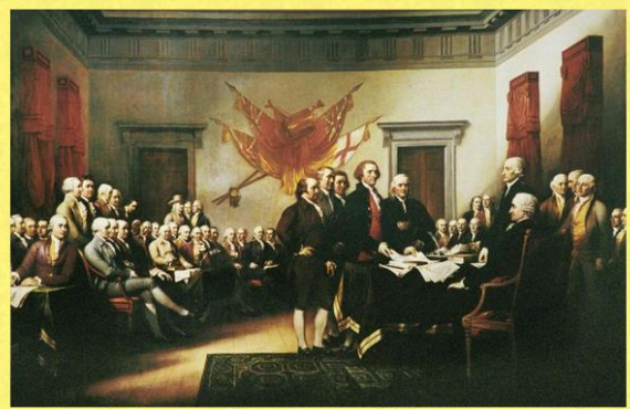
Declaración de Independencia de 4 de julio de 1776. En el grupo central de la pintura, Thomas Jefferson, el autor principal de la Declaración, deposita el documento ante John Hancock, presidente del Congreso. Con él están los demás miembros de la comisión que creó el proyecto: John Adams, Roger Sherman, Robert Livingston, y Benjamin Franklin. Esta pintura fue encargada por el Congreso de los EE.UU. a John Trumbull (1756-1843) en 1817.