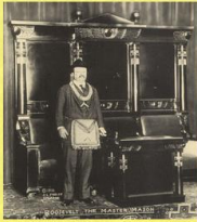
Theodor Roosevelt (Nueva York, 1858-1919) fue el vigésimo sexto Presidente de los Estados Unidos (1901 a 1909). Fue iniciado en la logia Matinecock n° 806 de New York