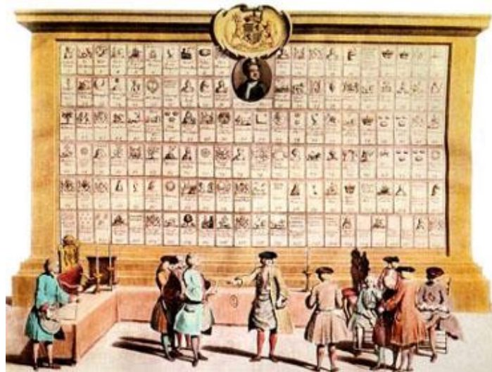
Panel-registro de las 129 Logias que en 1743 estaban reconocidas por la Gran Logia de Londres. Las nº 50 y 51 son de Madrid y Gibraltar respectivamente. Dibujo de Luis Fabricio de Bourg publicado en "Ceremonias y costumbres religiosas de todos los pueblos del mundo", Amsterdam, 1736.

Se acepta generalmente que lo que entendemos hoy por masonería nació en Gran Bretaña, especialmente en Escocia, a partir de las viejas logias operarias de los canteros. Entre estas cofradías figura, desde el siglo XIV, la Venerable Compañía de Masones, que en el siglo XVII albergaba un núcleo conocido con el nombre de «Aceptados» en el que podían ingresar otras personas. En efecto, hay en Escocia varios documentos que prueban que las Logias Operativas Masónicas aceptaban como miembros honorarios a individuos no relacionados con el oficio de canteros que, con el tiempo, llegaron a ser estamento predominante de las Logias. De hecho, durante bastante tiempo estuvo vigente una norma por la que al menos dos operarios masones debían estar presentes en el acto de iniciación de un candidato.