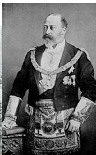
El rey Eduardo VII fue iniciado en Estocolmo en 1868 apadrinado por el rey de Suecia Carlos XV. En Inglaterra, actuó como Venerable en la Logia "Príncipe de Gales" N° 259, donde inició a su hermano, el duque de Connaught. En 1875 fue Gran Maestro de la Logia Unida de Inglaterra