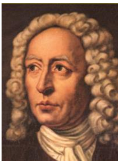
Anthony Sayer, primer Gran Maestro de la Gran Logia de Londres y Westminster desde 1717 hasta su muerte en 1721

En 1751 un grupo de francmasones formó una Gran Logia rival, la Gran Logia de Masones Libres y Aceptados de Inglaterra , argumentando que la Gran Logia creada en Londres había introducido innovaciones y se había apartado de los antiguos linderos de la Masonería. Por este motivo será denominada como la Gran Logia de los antiguos, en contraposición a la Primera Gran Logia que será conocida como la de los modernos. Para esta Gran Logia de los antiguos su Gran Secretario Laurence Dermott, compiló unos estatutos que denominó Ahiman Rezon , nombre hebraico que viene a significar “Una ayuda a un Hermano”.