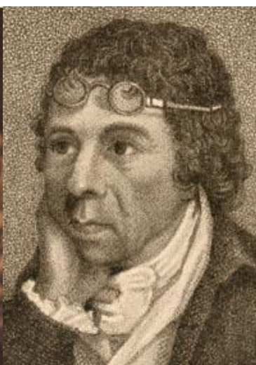
James Anderson (1678-1739), pastor presbiteriano cofundador de la Gran Logia de Londres y coautor, junto a Jean Théophile Désaguliers, de la primera Carta Constitucional de la francmasonería moderna o especulativa, conocidas comúnmente como las Constituciones de Anderson. En 1721 el Gran Maestro de la Gran Logia de Londres, el duque de Montagu, le encargó compilar las viejas constituciones masónicas. La primera edición de las constituciones fue publicada en 1723