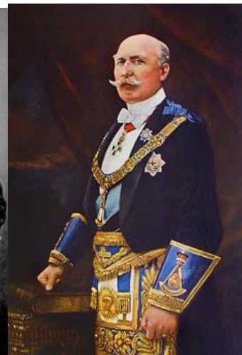
El príncipe Arthur, duque de Connaught, tercer hijo de la Reina Victoria, iniciado por su hermano el rey Eduardo VII en la Logia "Príncipe de Gales" N° 259

Gran Logia Unida de Inglaterra suele ser considerada como el principal referente mundial de la corriente masónica que se denomina regular, para distinguirla de la que admite la presencia de mujeres en la masonería y no establece para sus miembros la condición de creer en Dios o en un Ser Supremo y el juramento sobre un libro de la Ley Sagrada. Es aceptado por la generalidad de las Obediencias masónicas que la denominada regularidad de origen emana de la primitiva Gran Logia de Londres y Westminster. En este sentido, las Obediencias que se consideran regulares habrían recibido su carta patente directamente de esta Gran Logia o transmitida a través de otras Obediencias intermedias, cuyo primer eslabón sería la Gran Logia de Londres y Westminster.