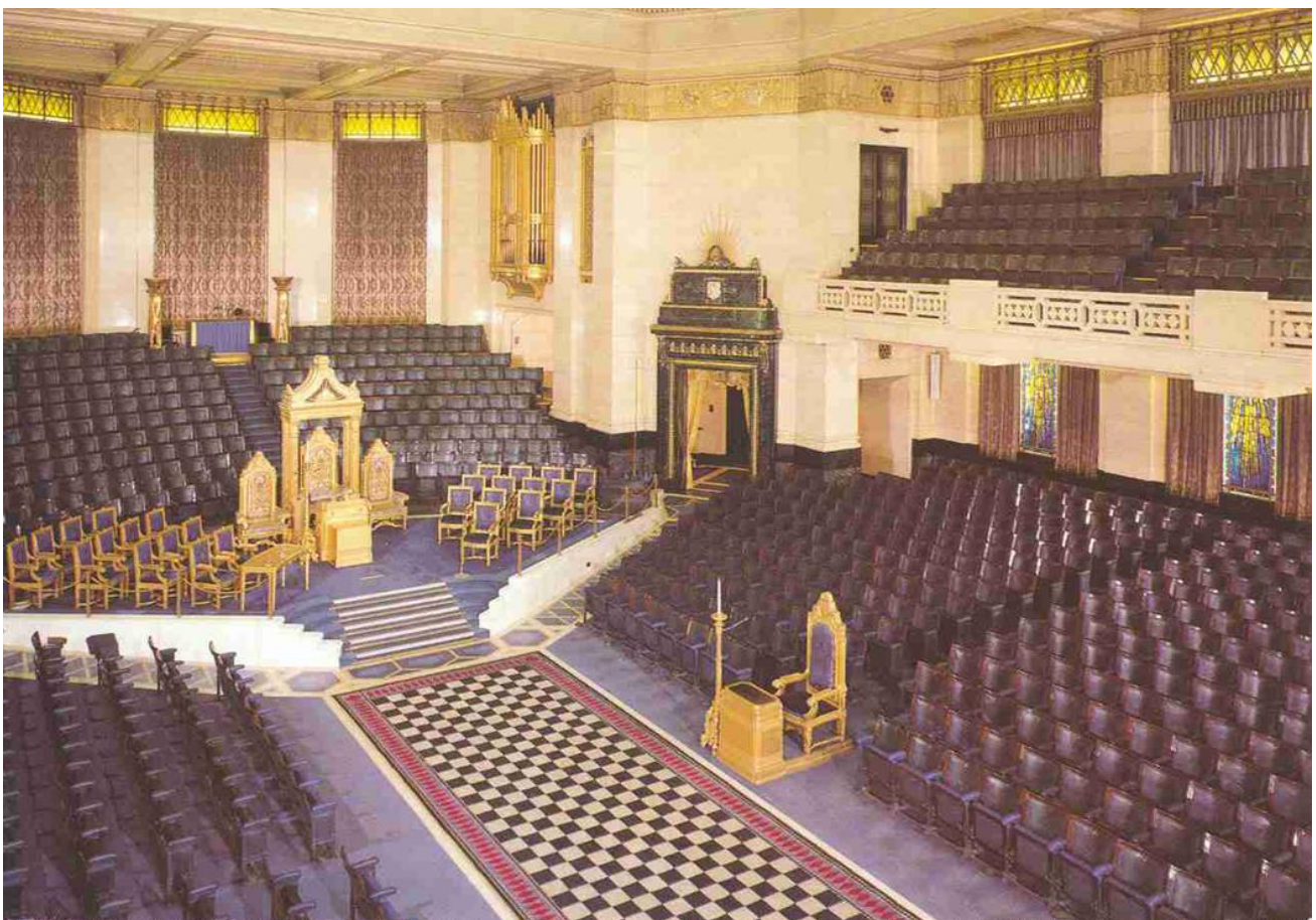
Templo principal de la Gran Logia Unida de Inglaterra (Londres)