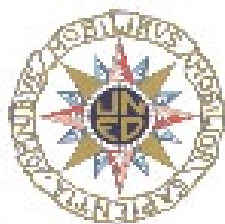
SPANISH NATIONAL DISTANCE UNIVERSITY (UNED)