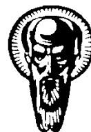
SOFIA UNIVERSITY ST. KLIMENT OHRIDSKI (SU)