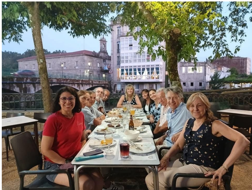
Participantes y ponentes del curso de verano sobre intelectuales y política, ante el balneario de Caldas de Reis