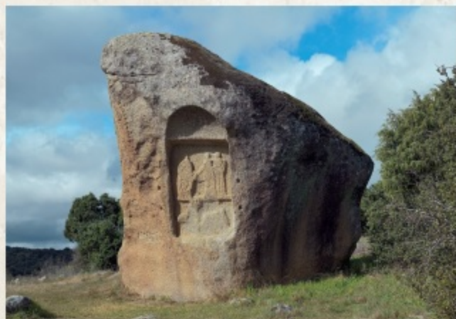
Monumento de Piedra Escrita (Cenicientos).

El dinamismo de la investigación arqueológica en la Comunidad de Madrid en los últimos años permite presentar una exposición con cerca de 700 piezas, inéditas en su mayoría, que proceden de 38 yacimientos: junto a los históricos como Carabanchel, Villa de Villa-verde (Madrid), Valdetorres de Jarama o la propia ciudad de Complutum (Alcalá de Henares), otros hallazgos más recientes han ayudado a completar el conocimiento del mundo romano en el centro peninsular, con necrópolis como La Magdalena (Alcalá de Henares), espacios productivos como los de Berrocales (Madrid) o Camino de Baracalde (Torrejón de Ardoz) y establecimientos viarios como El Beneficio (Collado Mediano). En la escala temporal, el recorrido parte de los ámbitos de contacto entre romanos e indígenas y las primeras fundaciones, como la de primitiva Complutum en el Cerro del Viso (Villalbilla), y finaliza en las ocultaciones tardorromanas de Camino de Santa Juana (Cubas de la Sagra) o La Recomba (Leganés), que anuncian un tiempo nuevo.