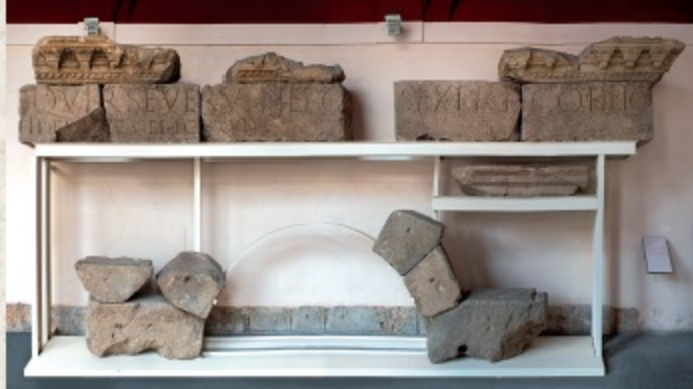
Arco de Titulcia.