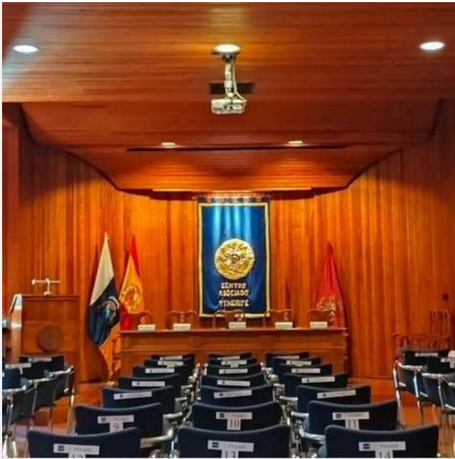
Salón de Actos