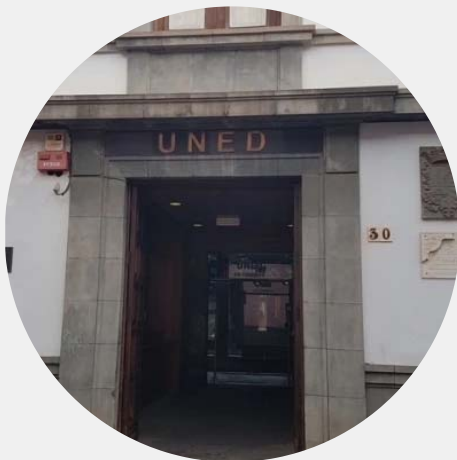
Entrada al edificio

El Centro Asociado a la UNED en Tenerife se crea en 1994 por iniciativa del Cabildo de Tenerife y del Gobierno de Canarias, para facilitar a los habitantes de las islas