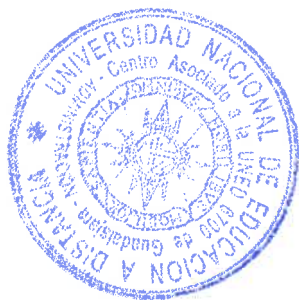
Fdo.: Lorena Jiménez Nuño