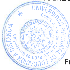
Fdo.: Lorena Jiménez Nuño