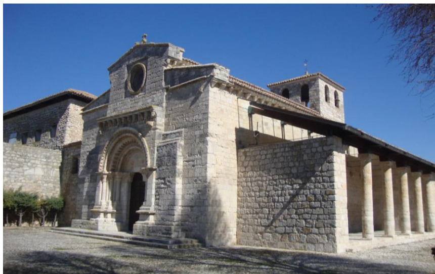
La Orden de San Juan de Jerusalén luchó siempre por conservar los privilegios y donaciones. Santa María de Wamba, recibida en 1140 por donación de la infanta doña Sancha, hermana de Alfonso VII, supuso la ampliación románica de una iglesia visigoda realizada por los hospitalarios, como sede de una de las principales encomiendas en el Gran Priorato de Castilla y León.

legado espiritual vivo, y ofreceremos un listado de todas las iglesias, ermitas, santuarios y monasterios de la Orden de Malta en España como aproximación a su patrimonio eclesiástico.