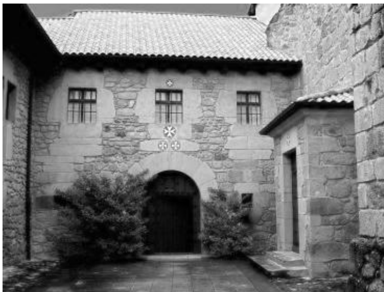
Atrio del Monasterio de San Juan de Acre en Salinas de Añana, que alberga la única comunidad de comendadoras sanjuanistas que queda en España.

• San Juan de Acre en Salinas de Añana 60 (Álava). Es el único monasterio femenino que queda de las Comendadoras de San Juan de Jerusalén en España. Posee un pequeño patio abierto al Este y una portada con arco de medio punto en cuya dovela resalta la cruz de la Orden de Malta. Fue levantado en el siglo XIV sobre otro anterior que