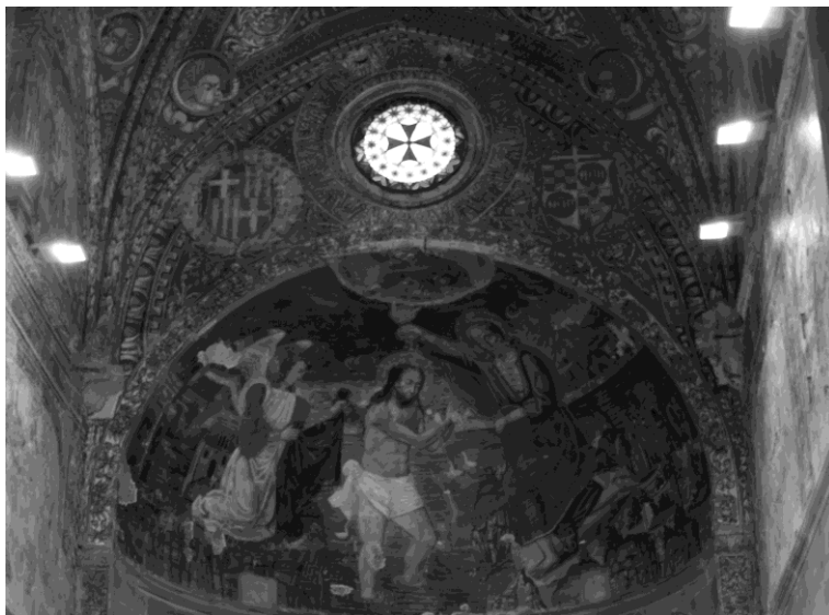
En la Orden-corporación los comendadores restaurarían las iglesias hospitalarias destacando tanto la cruz de Malta como el Bautismo de Cristo, signos de pertenencia a la Orden de San Juan de Jerusalén, que custodiaba los valores más esenciales del cristianismo en el mundo cambiante de los siglos XVI, XVII y XVIII. Abside de la capilla mayor de la iglesia de San Juan del Mercado en Benavente.