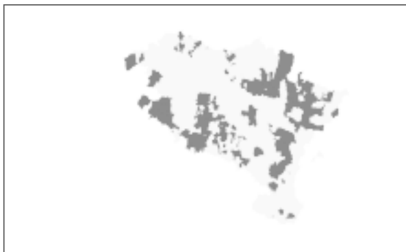
Mapa 1: Municipios Agrarios (Municipios con más de un 25% de Activos Agrarios)