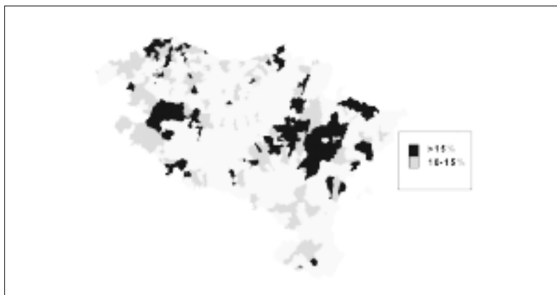
Mapa 2. Nuevos residentes. (Proporción de mayores de 10 años, llegados al municipio en la última década)