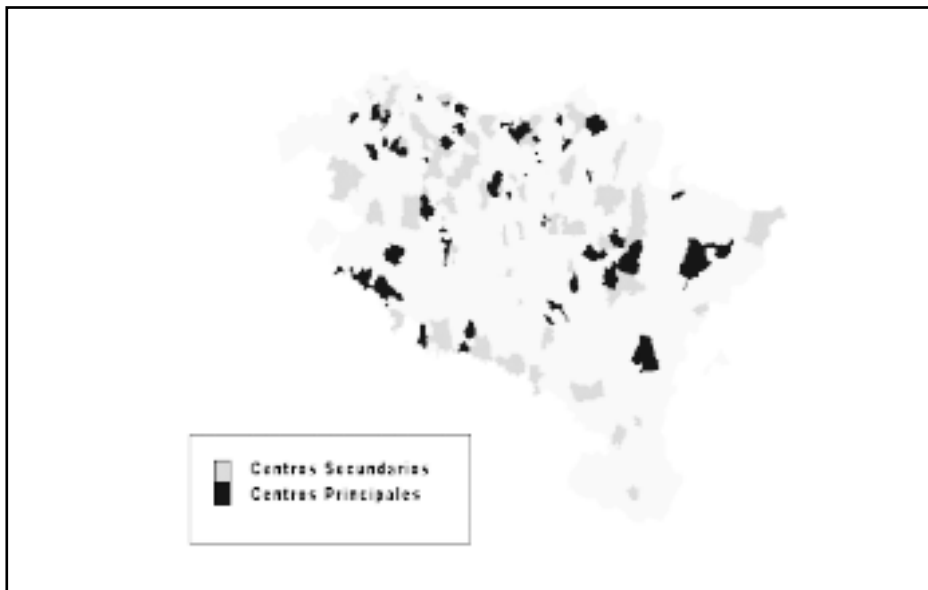
Mapa 3: Municipios que atraen commuters