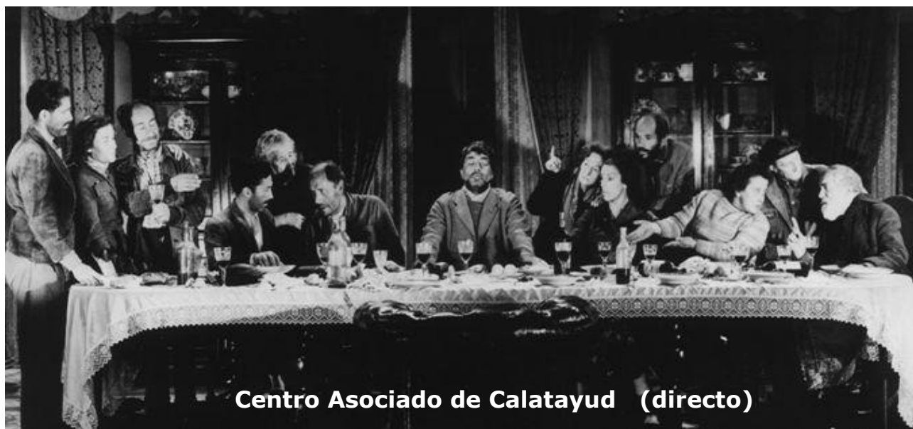
Centro Asociado de Calatayud (directo)

https://www.intecca.uned.es/portavip/directos.php?ID_Grabacion=52540&ID_Sala=96034