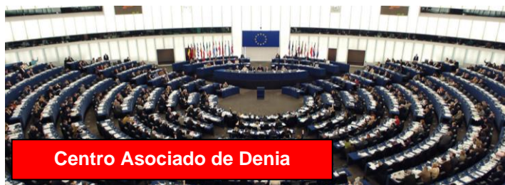
Centro Asociado de Denia

http://www.intecca.uned.es/portavip/grabacion.php?ID_Grabacion=92595&ID_Sala=3&hashData=e231956d2e124b2ac75bdec86f1f73e1&paramsToCheck=SURfR3JhYmFjaW9uLElEX1NhbGEs