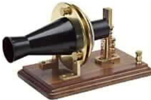
Uno de los primeros teléfonos, sistema Bell (1879).

Esta semana les ofreceremos varios programas relacionados con " Hallazgos y creaciones ", este temas es tratado desde distintas disciplinas científicas.