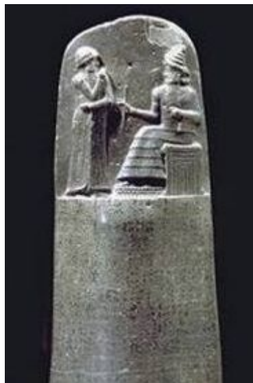
Código de Hammurabi. Museo del Louvre.

Esta semana les ofreceremos varios programas relacionados con " Hablando por derecho ", este temas es tratado desde distintas disciplinas científicas.